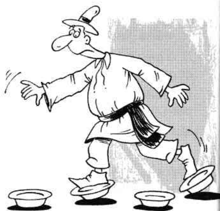
A călca în străchini.