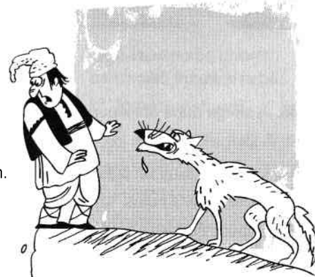
A ajunge la ananghie.