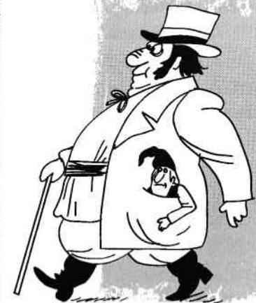
A avea pe cineva în buzunar.