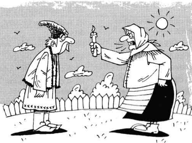
A căuta bucluc cu lumânarea.