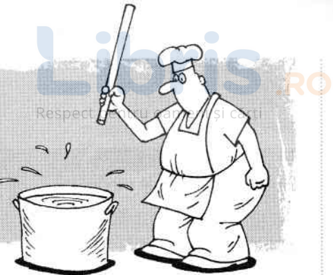
A bate apa să aleagă unt.