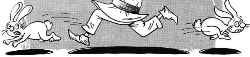
A alergia după doi iepuri.