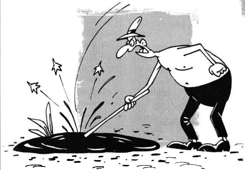
A da cu băta-n baltă.